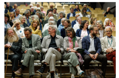
Klar for åpning av festivalen!