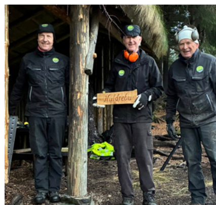
Vedlikehold av «Huldrebu» i Smøråsfjellet