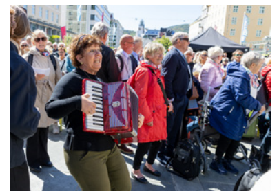
Liv og røre med Generasjonssang på Festplassen!

Vi skaper kreative og menneskesenterte samarbeidsprosjekter med våre partnere for å bidra med konkrete eksempler på den politiske visjonen om at vi må gjøre ting på nye måter på eldrefeltet. Vi ønsker å skape endring hos den enkelte, i organisasjoner og på samfunnsnivå. Generasjon skal være en arena for kulturelle, kritiske og anti-diskriminerende perspektiver for en mer rettferdig, god og levende alderdom