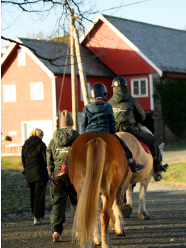
Ridning på Helgeseter Gård.

ikke får dekket behandlingskostnader gjennom det offentlige, samt midler til oppgradering av nødvendig utstyr.