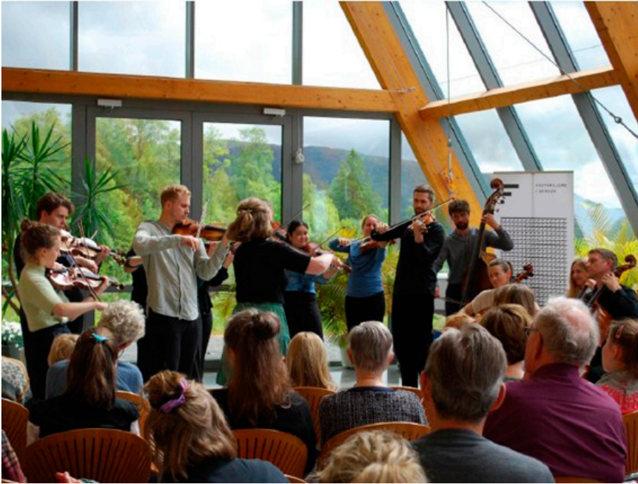
Ensemble Allgria på Helgeseter.

«Tusen takk for et fantastisk samarbeid og for de utrolig flotte arrangementene omsorgsboliger, aktivitetssentre og sykehjem fikk av dere. Håper også at utøverne har følt seg velkommen og ivaretatt der de har vært. TUSEN takk for oss og for at dere satser på seniorene som ikke så lett kan delta som tidligere.»