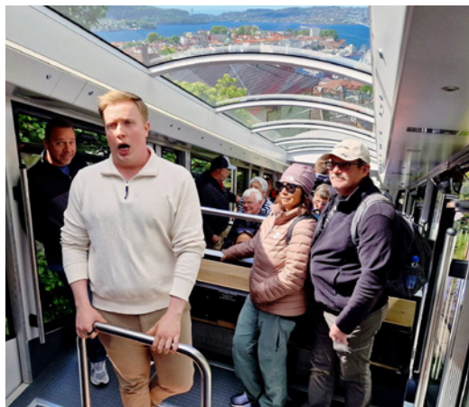
Flere unge talenter sang på Fløibanen til stor glede for passasjerene