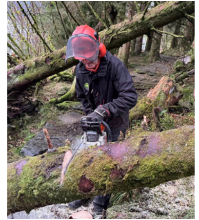
Rydding etter storm i Smøråsfjellet