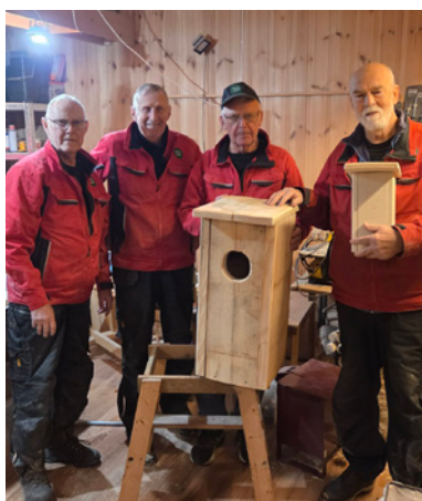
Når det er for kaldt ute lages det fuglekasser inne. Myrdalsvannets Venner.

GC Rieber Fondene oppmuntrer og støtter frivillig arbeid både i skog og mark, men også andre deler i samfunnet. GC Rieber Fondene kan ikke støtte alle mulige prosjekter, men vi kan velge å støtte de viktigste formålene som ikke lenger blir prioritert ved offentlige bevilgninger.