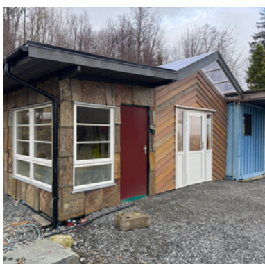
Det nye verkstedsbygget