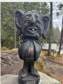
Lille Olle Bolle

I Trollskogen er det kommet nye troll finansiert av GC Rieber Fondene.