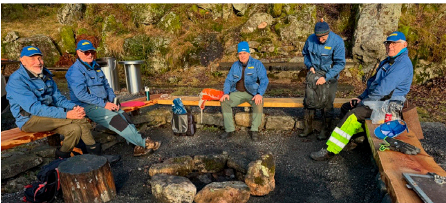
Lunsj i Alvøen