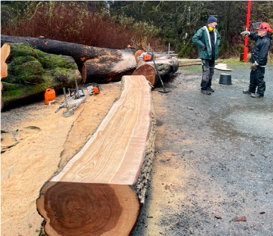
I Krohnåsen jobbes det flittig.