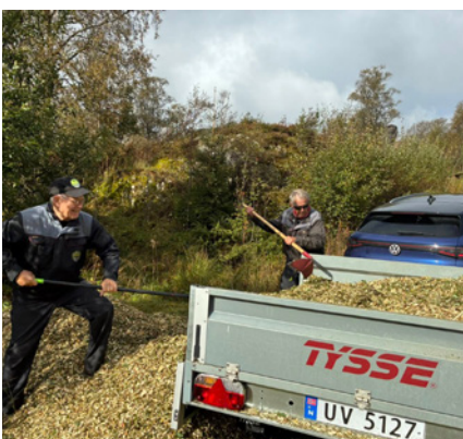
Driftige folk i Smøråsfjellets Venner.